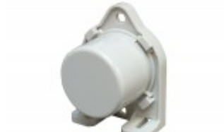
CZUJNIK TEMPERATURY ZEWNĘTRZNEJ