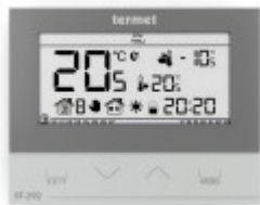
TERMET ST-292 v3