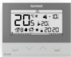
TERMET ST-292 v3