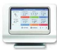
Pakiet sterujący EvoHome komunikacja Open-Therm