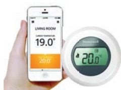
Pakiet sterujący Round komunikacja Open-Therm