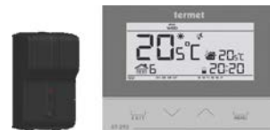
termet ST-292 V3 termet ST-292 V2